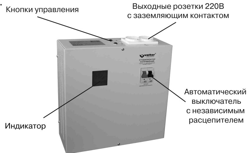
Рис.1. Стабилизатор (вид спереди)

Стабилизатор (рис.1) выполнен в металлическом корпусе прямоугольной формы, который позволяет эксплуатировать его как в настенном, так и в настольном варианте. Все функциональные узлы стабилизатора расположены на задней части корпуса и закрыты лицевой частью.